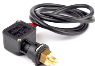
Presostat PS6 Presiune operare: 250 bar Temperatura maxima: 90 C ( optional )