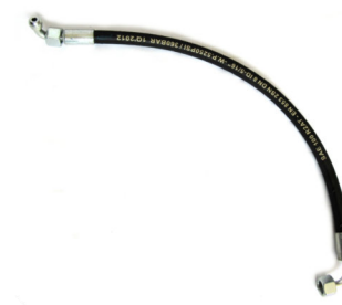
Furtun retur by pass Lungimea: 50 cm, DN8, SN2, 350 bar ( optional )