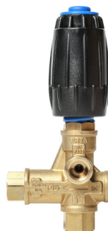
Supapa By Pass VRT3 Presiune operare: 250 bar Debit de apa: 30 l/min ( optional )