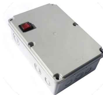
Automatizare Transformator 24V-400V, contactor, releu termic ( optional )